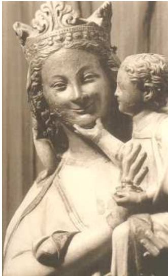
La Vergine Bianca, Cattedrale di Toledo

In lei riposa la certezza che è Dio con la Sua forza a portare a compimento l'opera che noi ora stiamo facendo. Quando è riscoperta la conoscenza di questa positività gioiosa di tutto, si può lavorare lieti, perché la bontà dell'opera è già nella sua origine, all'inizio. Ogni opera dell'uomo diventa oblazione di lode, offerta per la gloria di Cristo.