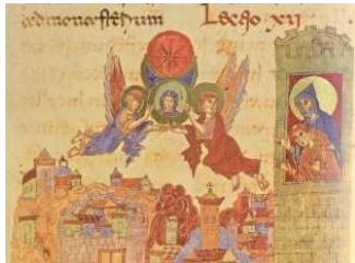
San Benedetto vede il mondo intero raccolto sotto un unico raggio di sole, Codice Vaticano, XI sec.

«Ciò di cui abbiamo bisogno in questo momento della storia sono uomini che tengano lo sguardo dritto verso Dio, imparando da lì la vera umanità. Soltanto attraverso uomini che sono toccati da Dio, Dio può far ritorno presso gli uomini. Abbiamo bisogno di uomini come Benedetto da Norcia. Le raccomandazioni ai suoi monaci sono indicazioni che mostrano anche a noi la via che conduce in alto, fuori dalle crisi e dalle macerie». (J. Ratzinger)