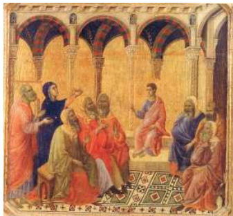
Duccio di Boninsegna, Gesù ritrovato nel Tempio fra i dottori della Legge, 1308-1311

Il cristianesimo, l'annuncio del Vangelo, è all'origine di questa coscienza, di questa unità spirituale, come bene dimostrano già gli albori della sua storia attraverso i nomi di Benedetto, patriarca dell'occidente, e di Cirillo e Metodio, i fratelli slavi». (Giovanni Paolo II)