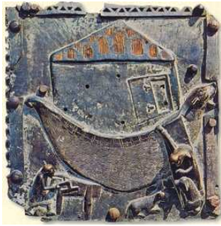
Noè costruisce l'arca, portale San Zeno, Verona, XII sec.