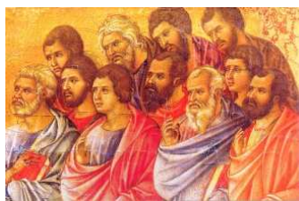
Duccio di Boninsegna, Gruppo di apostoli, 1308-1311

Per raggiungere questo ideale di umanità perfetta bisogna che gli uomini possano appoggiarsi su comunità imperfette ma reali. Queste "unità" imperfette ma reali coincidono con la compagnia cristiana, cioè la Chiesa, non astrattamente concepita, bensì quella che si incontra in una realtà udibile e toccabile. Questa compagnia cristiana "sta" per un solo motivo, sta insieme solo perché c'è Cristo, per dedizione a Cristo e pietà per il mondo, perché il mondo conosca Cristo.