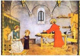
M. Faustini, La Sacra Famiglia, Loreto, XIX sec.

«Tutto, l'istante, le circostanze, la nostra disponibilità, la nostra obbedienza fino all'incomprensibile sacrificio, sono per una costruzione. Non una costruzione al di là dell'orizzonte ultimo, ma in questo mondo. Dio si lega alla storia per una costruzione dentro la storia, dentro l'effimero.