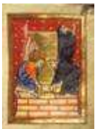
San Cutberto costruisce il suo eremo, Inghilterra, XII sec.

Ora et labora non è la giustapposizione di due aspetti dell'esistenza, ma la coincidenza tra la realtà quotidiana e il rapporto con Cristo.