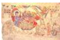
Natività, miniatura su pergamena, XI sec.

Il Verbo si è fatto carne ed è venuto ad abitare in mezzo a noi (Gv 1.14)