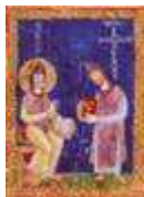
San Benedetto consegna la regola all'abate Teobaldo, Montecassino, XI sec.

L'umile accettazione delle condizioni in cui Cristo chiama è la strada al proprio compimento umano. Il monaco è chiamato a modellare ogni suo gesto secondo la vita della comunione, nella preghiera, nel lavoro, nello studio, nei raduni, a mensa, nel dormitorio, ovunque.