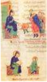
San Benedetto accoglie un fanciullo e lo educa, miniatura, XI sec.

Benedetto non comunica un discorso o una teoria, ma ciò che egli stesso ha imparato dalla sua esperienza. Lo fa attraverso un rapporto tra padre e figlio, per coinvolgere l'altro nella sua stessa esperienza e fare il cammino con lui. Nel correggere i fratelli ha sempre presente la propria fragilità. Si sforza di essere amato più che temuto. Dispone tutto con discrezione in modo che i forti possano desiderare di progredire ulteriormente e i deboli non si sgomentino.