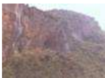
Grotta nei pressi del Sacro speco, Subiaco

Nel momento in cui la civiltà romana era in piena decadenza e andava verso la distruzione, Dio pose dentro di essa il seme di un nuovo inizio di vita: Benedetto. Chiamato da Dio durante gli studi letterari, lasciò tutto e visse per tre anni in uno speco solitario nei pressi di Subiaco, non volendo "anteporre nulla all'amore di Cristo".