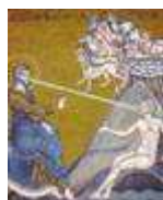
Dio crea l'uomo

L'uomo è l'opera principale di Dio nella creazione, è il suo capolavoro. Egli è stato creato per riconoscere, amare, servire Dio.