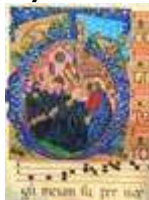
Cristo porge a

San Benedetto, plasmato da Dio nello speco, incominciò ad esercitare un'attrattiva tale che molti si raccolsero intorno a lui in quel luogo, per passare da una vita disordinata ad una vita di grazia. Istituì per questo scopo una "scuola per il servizio del Signore" dove si impara attraverso la testimonianza reciproca, a correggere i propri vizi, a conservare la carità e a progredire nella fede fino a dilatare il cuore nell'amore a Cristo.